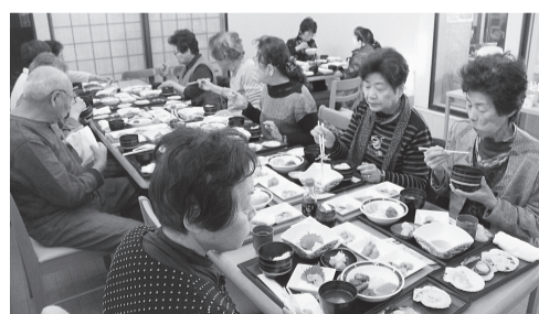
船長の家でホタテづくしの昼食を楽しみました

今年は、北見菊祭りというコースで、23名が参加しました。当日は朝から天気もよく、絶好の旅行日よりでした。