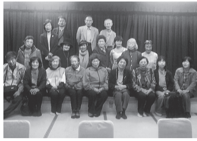
恒例の秋の旅行で満喫

心配していた雨も大丈夫そうなので、エコロジパークや千代田えん堤、士幌の道の駅、ナイタイ高原など欲張って回り、紅葉や雄大な景色を楽しみ、買い物も楽しみました。温泉では早速美味しい料理を堪能し、ゲームのテニスボール運びやボールつきに熱狂。豪華？景品をもらって初参加の人もすっかり打ち解け仲良しに。大浴場の窓や露天風呂からは美しい紅葉が楽しめます、心からくつろげ