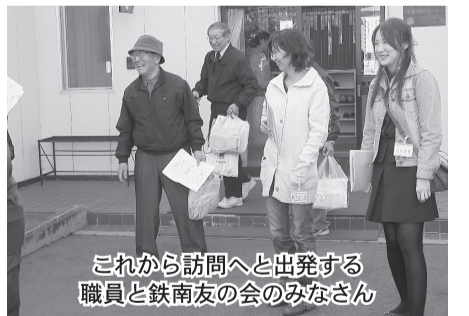
これから訪問へと出発する職員と鉄南友の会のみなさん

帯広病院では、10月14日（金）と11月4日（金）に鉄南友の会と合同の地域訪問を行いました。2回の地域訪問で、帯広病院の職員14名、鉄南友の会11名の参加でした。訪問当日は、いくつかのグループに分かれ、署名のお願いや大腸がん検診のお願い、健診の呼びかけ、無料・低額診療事業のご案内などを行いました。訪問先では、年金が少なくして生活が大変、その上高い保険料を支払わなくてはいけない、無年金で家族に支障してもらいながらなんとか生活している、など地域の方々の大変な生活状況を伺うことができました。