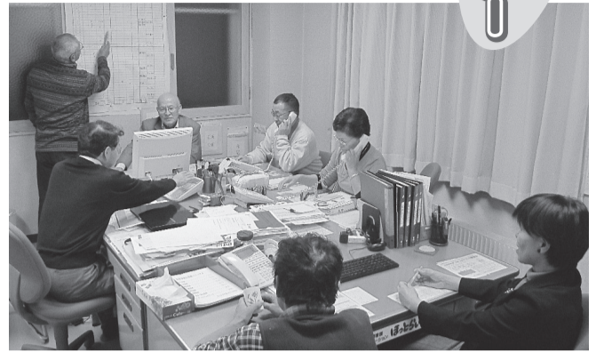
各地の友の会と連絡をとる 友の会連絡会四役

10月22日～23日の土・日に「友の会お誘いデー」を行いました。お誘いデーは、今年で8年目をむかえ、各友の会の月間目標を達成するため、独自の行動を計画し、「月間」最大の取り組みとして位置づけています。