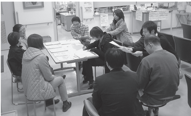
終了後のミーティングで困難な事例や問題点などが報告されます。

ていします。また、「わずかな年金で暮らしては大変」「2回も相談に行ったら断られた、生活保護はもうイヤ」など切実な状況も伝わってきます。参加した職員からは「本当に困難な方がいらつしやる事に驚いた」と率直な感想も出ます。